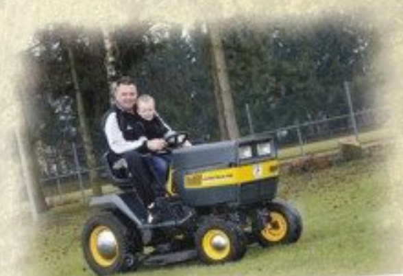
Frühzeitig den Nachwuchs für die Vereinsarbeit begeistern.

„Freizeit- und Sportförderung ist Sozialpolitik, das freiwillige Engagement braucht breite Unterstützung!“